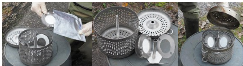
Joonis 1 Passiivne proovivõtja

Plaanitavad asukohad võivad vähesel määral muutuda sõltuvalt passiivsete proovivõtjate paigaldamise võimalikkusest antud asukohas.